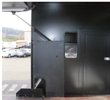
Accès cabine de pilotage / Control room access