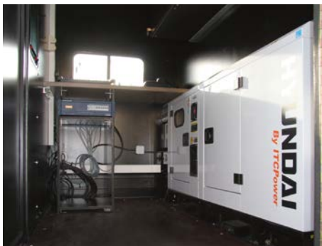
Cabine de pilotage / Control room