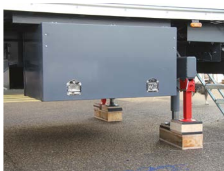
Béquille hydraulique et coffre de rangement / Hydraulic jack and storage box