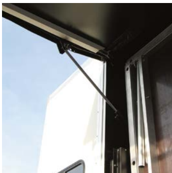
Vérin hydraulique d'ouverture / Opening hydraulic jack