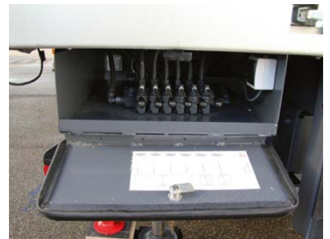
Manette de pilotage hydraulique / Hydraulic piloting handle